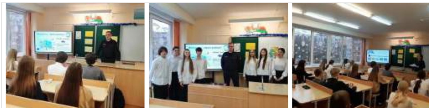
Государственное учреждение образования «Средняя школа № 7 г. Волковыска»

Тема «Молодость – время выбора. Профессиональное самоопределение» (основы профессионального выбора; встречи с молодыми профессионалами с активной гражданской позицией)