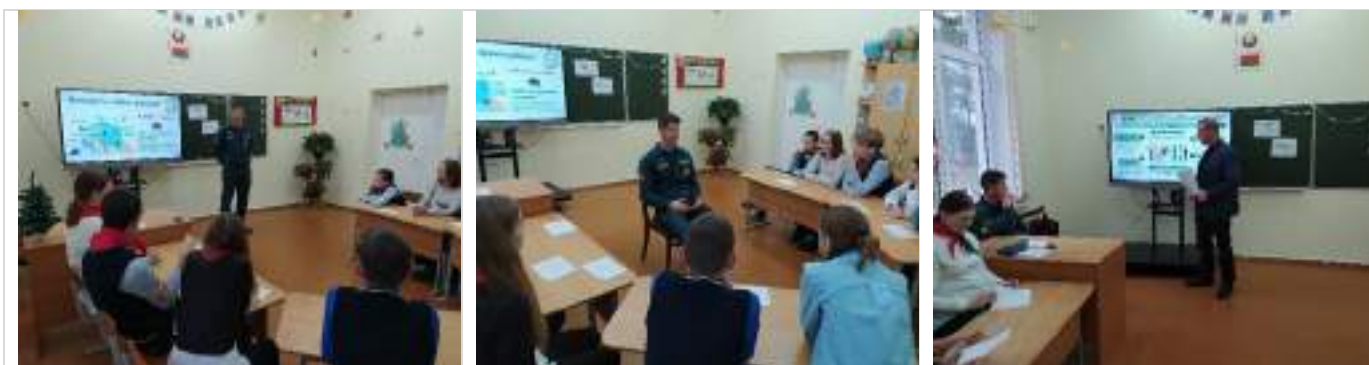
Государственное учреждение образования «Полецкишская базовая школа»

Подробнее о мероприятии: https://clck.ru/3FT88L